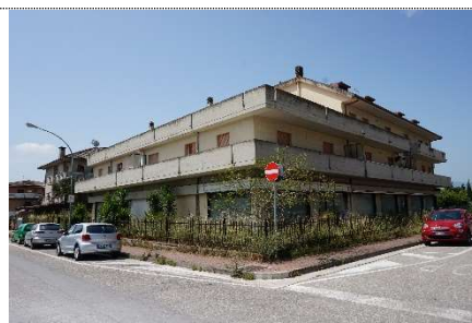
12. Vista fabbricato map. 638