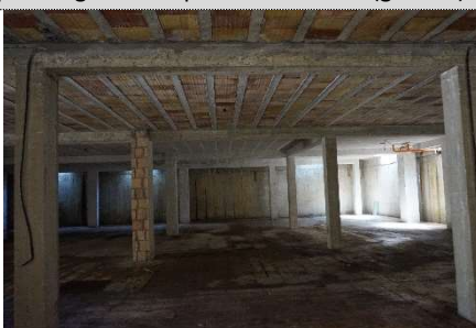
16. Autorimessa map. 638 sub 17 e 4 (graffati)