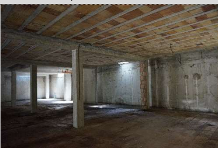
15. Autorimessa map. 638 sub 17 e 4 (graffati)