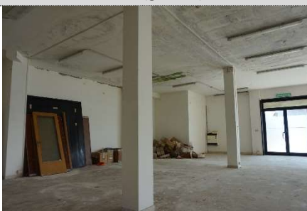
20. Diversa distribuzione negozio map. 638 sub 13 e 3 (graffati)