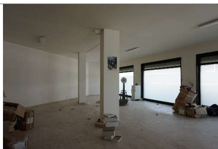
22. Diversa distribuzione negozio map. 638 sub 13 e 3 (graffati)