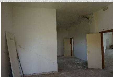
18. Ufficio map. 638 sub 12 e 2 (graffati) con porte di collegamento con sub 13 e 3 (graffati)