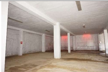
5. Autorimessa map. 108 sub 17 e 2 (graffati)