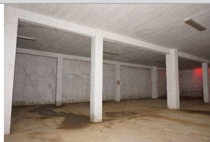
4. Autorimessa map. 108 sub 17 e 2 (graffati)