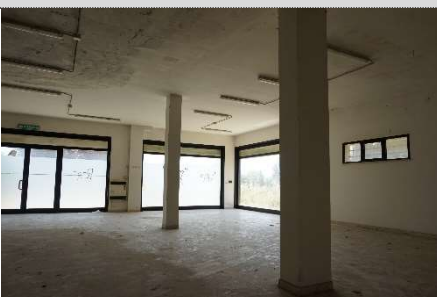
19. Negozio map. 638 sub 13 e 3 (graffati)