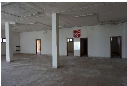
21. Negozio map. 638 sub 13 e 3 (graffati) con porte di collegamento con sub 12 e 2 (graffati)