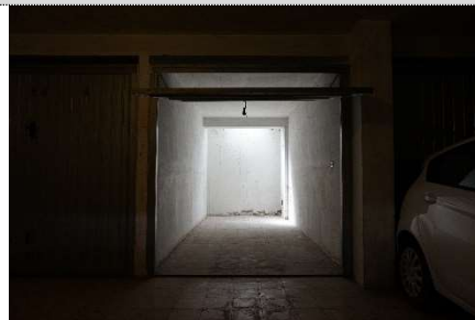
10. Garage map. 108 sub 20