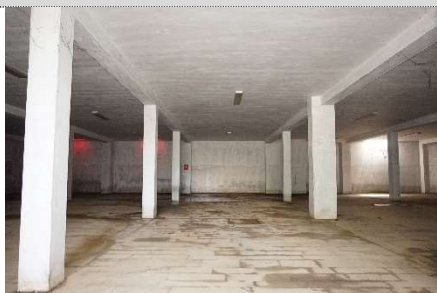
3. Autorimessa map. 108 sub 17 e 2 (graffati)