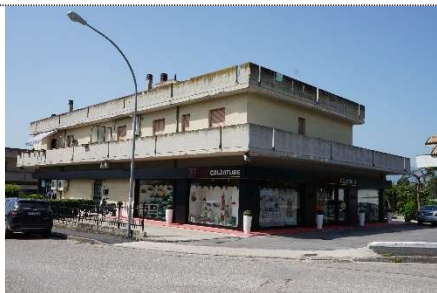
1. Vista fabbricato map. 108