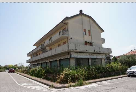
13. Vista fabbricato map. 638