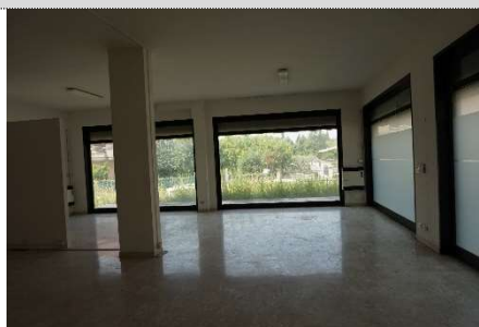
24. Diversa distribuzione negozio map. 638 sub 13 e 3 (graffati)