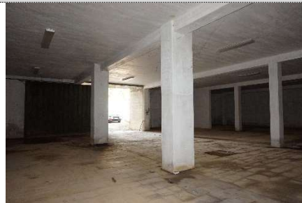
6. Autorimessa map. 108 sub 17 e 2 (graffati)