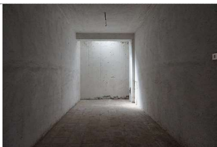
11. Garage map. 108 sub 20