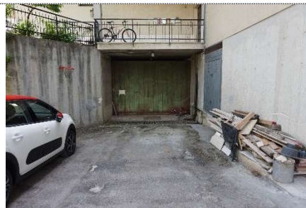
2. Rampa di ingresso map. 108 sub 17 e 2 (graffati)