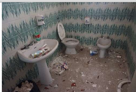
26. Bagno del negozio map. 638 sub 13 e 3 (graffati)