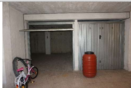
8. Garage map. 108 sub 23