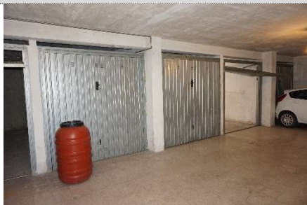
7. Spazi di accesso comuni ai garage map. 108 sub 20 e 23