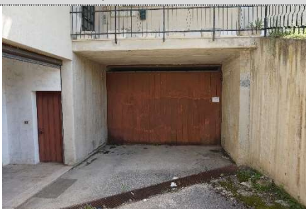
14. Rampa di ingresso map. 638 sub 17 e 4 (graffati)