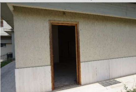
17. Ingresso ufficio map. 638 sub 12 e 2 (graffati)