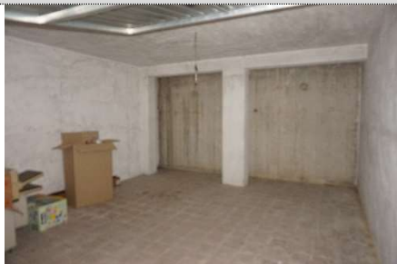
9. Garage map. 108 sub 23