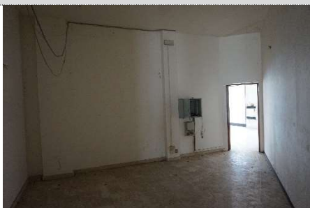
25. Diversa distribuzione negozio map. 638 sub 13 e 3 (graffati)